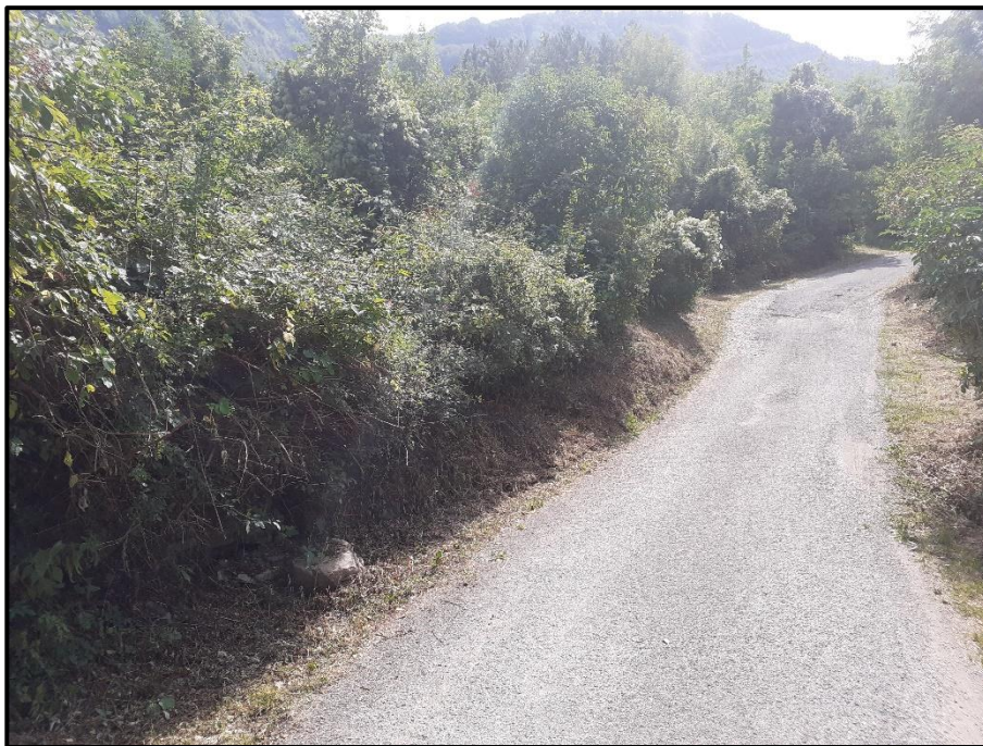
Foto 6: particolare del dissesto incombente sulla strada comunale per i Cordani in prossimità del centro abitato.