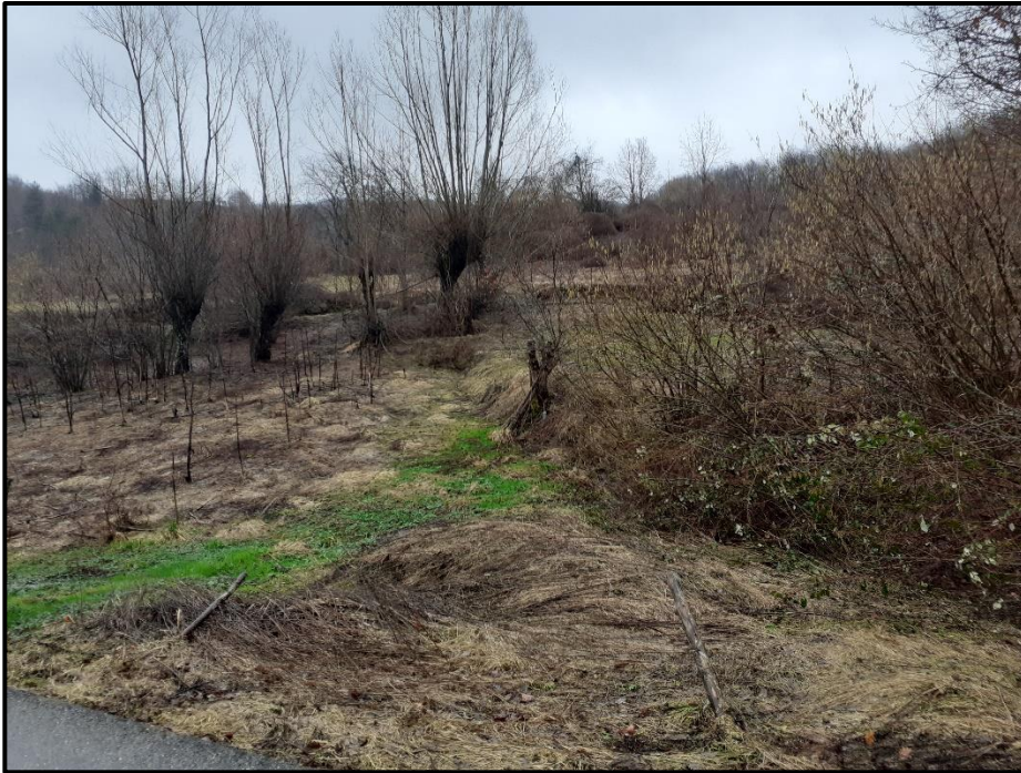
Foto 2: particolare del movimento franoso che interessa il versante in località Tornarezza – comune di Ferriere -.