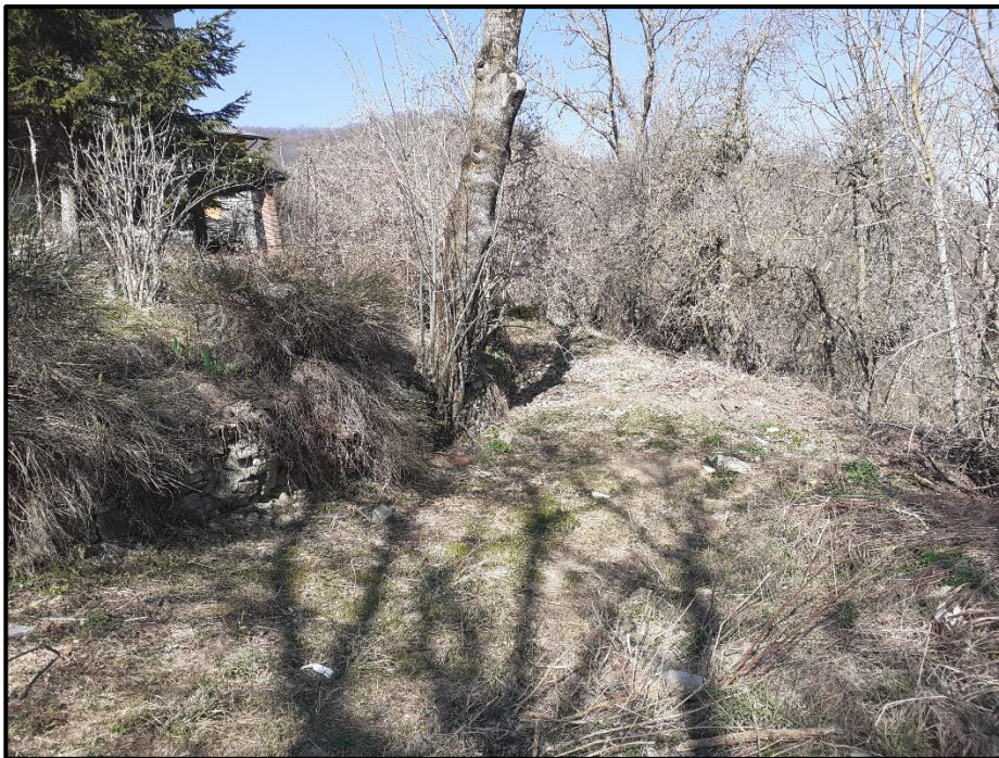
Foto 9: particolare del dissesto in corrispondenza dei fabbricati del centro abitato di Campagna – comune di Farini -.