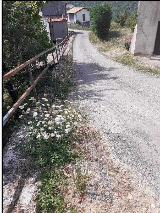
Foto 5: particolare della strada comunale in corrispondenza della località Agnelli e del muro di sostegno in cemento armato in corrispondenza del quale si interverrà con sostituzione del drenaggio in ghiaia costituente il cassonetto stradale.