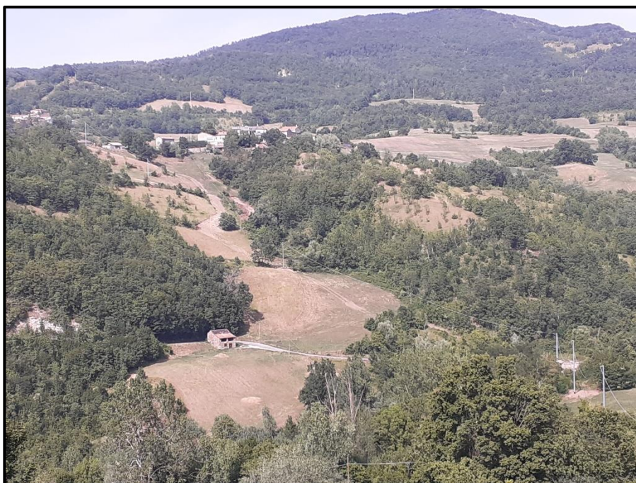
Foto 3: vista del versante in corrispondenza della località Agnelli di Groppoduciale – comune di Bettola –