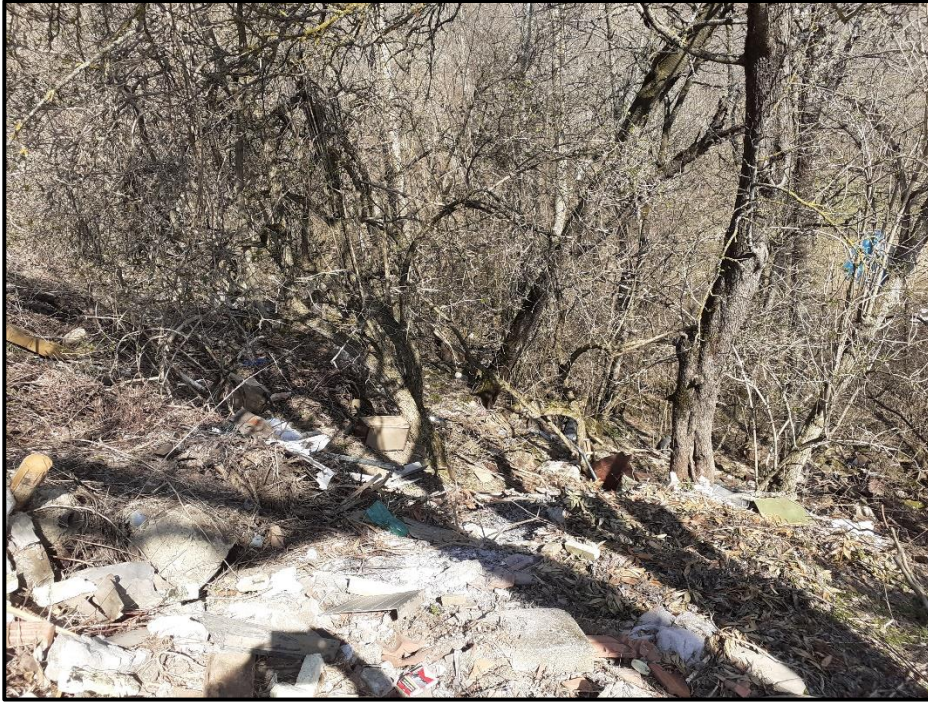
Foto 8: particolare del versante in dissesto in corrispondenza del centro abitato di Campagna – comune di Farini –