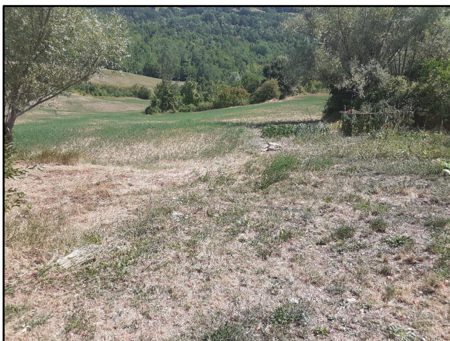
Foto 4: immagine del versante in località Agnelli oggetto di intervento di drenaggio e pulizia canali secondari