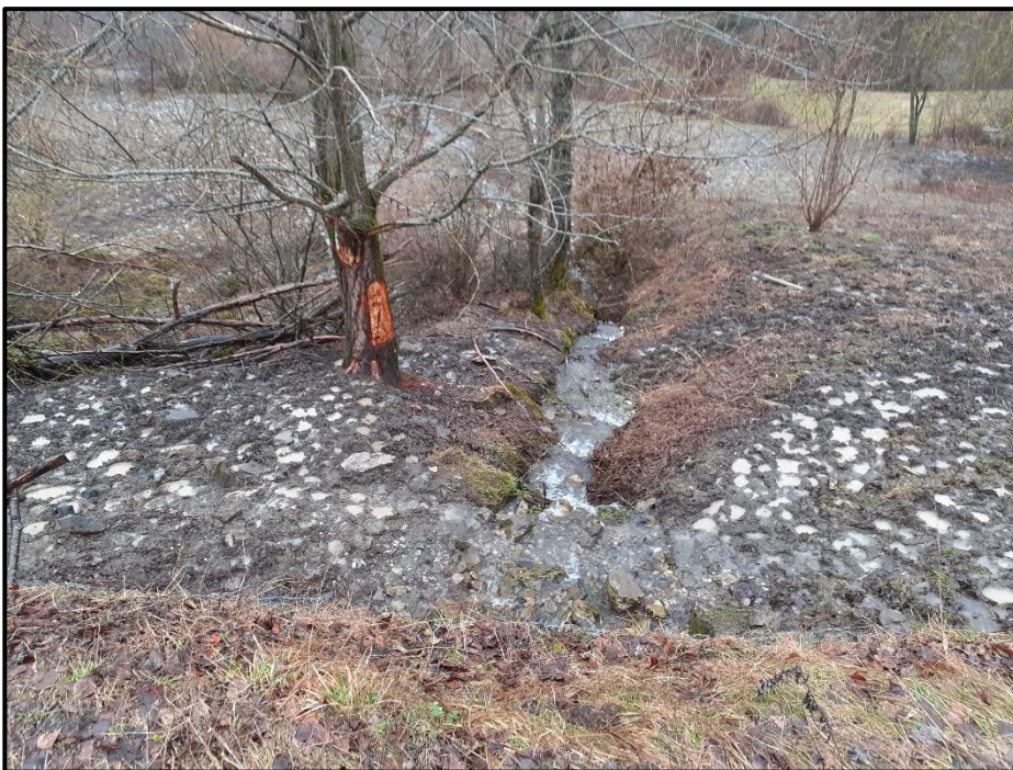
Foto 1: immagine del versante instabile a monte dell'abitato di Tornarezza – comune di Ferriere -.