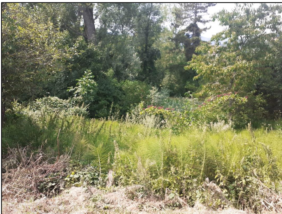
Foto 7: particolare del dissesto in corrispondenza del centro abitato dei Cordani.