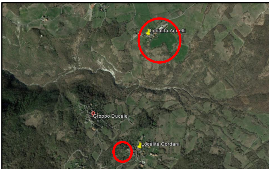
Immagine aerea delle località Agnelli e Cordani – Groppoducale – comune di Bettola con indicate le zone in dissesto.