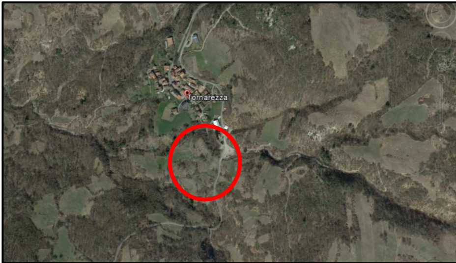
Immagine aerea della località Tornarezza con indicata la posizione del dissesto franoso